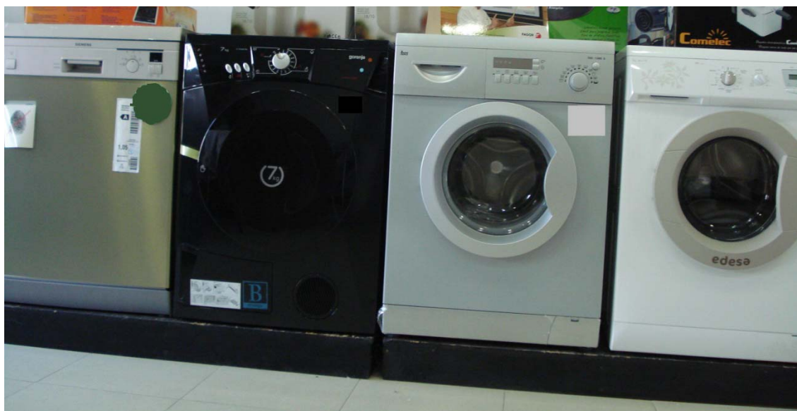
Presentación adecuada de la etiqueta