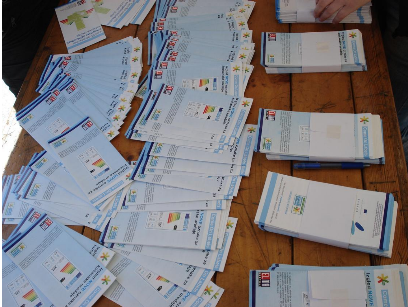
New energy leaflet for end user and consumers