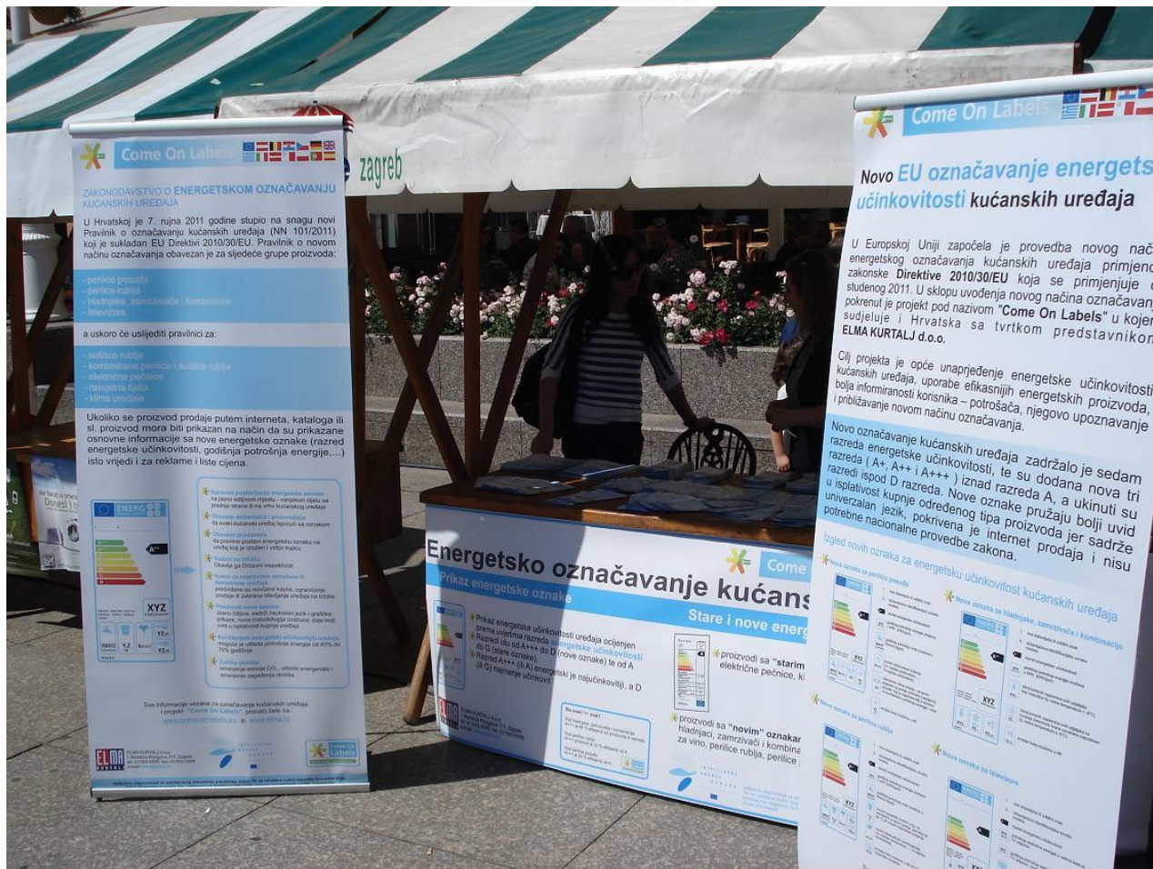
Come On Label project stand