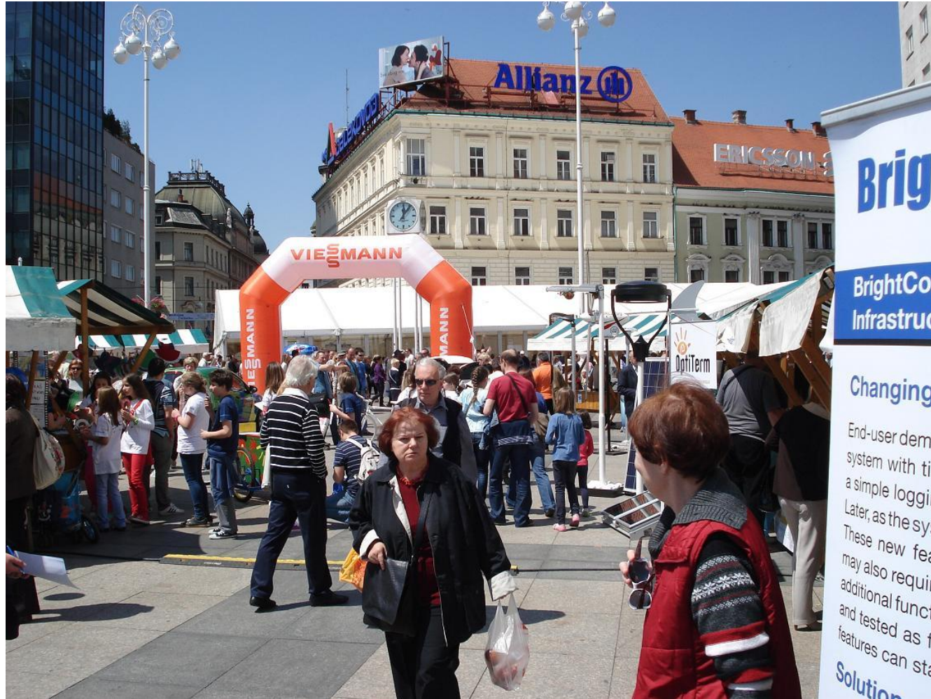
Zagreb energy week exhibition